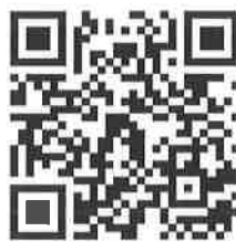
(แบบประเมินหลัง)

๑๐. ขอให้ผู้เข้าสอบทุกคน ทำแบบสอบถามเพื่อประเมินผลการป้องกันการแพร่ระบาดของโรคติดเชื้อไวรัสโคโรนา 2019 (COVID-19) ภายหลังจากเข้ารับการประเมินสมรรถนะ(สอบข้อเขียน) ไปแล้ว โดยให้สแกน QR Code หรือเข้าไปที่ https://forms.gle/H3Hu6jzeDr5AZgT46 โดยสามารถตอบแบบสอบถามได้ตั้งแต่วันที่ ๑๑ - ๑๕ สิงหาคม ๒๕๖๔ เพื่อการติดตามผลและป้องกันการแพร่ระบาดของโรคติดเชื้อไวรัสโคโรนา 2019 (COVID-19)